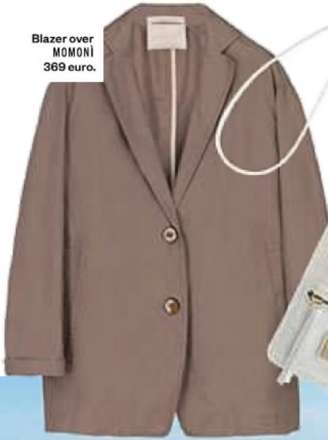
Blazer over MOMONI 369 euro.