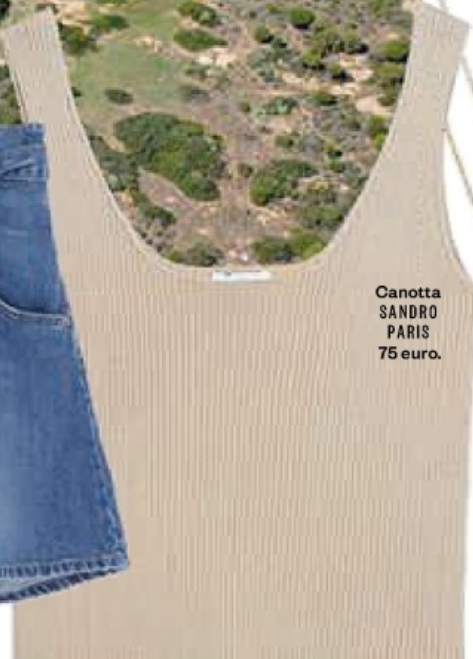
Canotta SANDRO PARIS 75 euro.