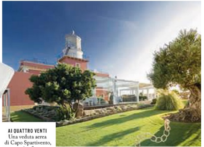
AI QUATTRO VENTI Una veduta aerea di Capo Spartivento, storico faro ottocentesco sulla punta meridionale della Sardegna.