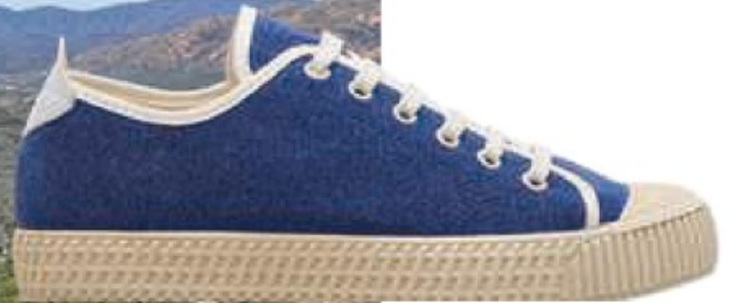
Tennis in tessuto CAR SHOE 185 euro.